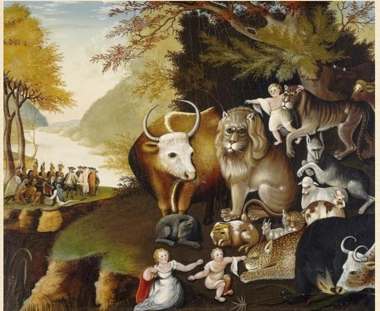
Edward Hicks, (1780-1849), Royaume pacifique, 1834, National gallery of art, Washington, DC